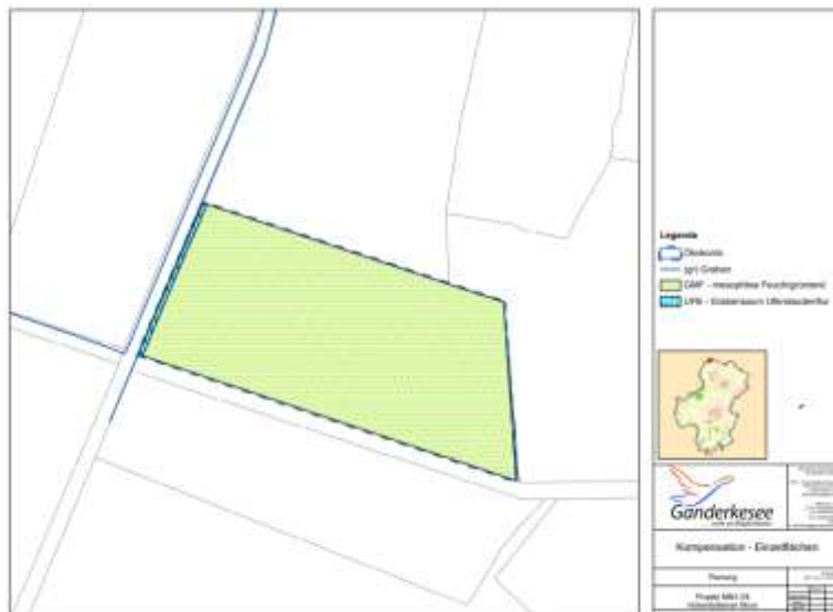
Abbildung 3: Maßnahme MM1.08 aus dem Flächenpool der Gemeinde Ganderkesee

Über die Maßnahme MM1.08 (Flurstück 5, Flur 2, Gemarkung Ganderkesee) werden insgesamt 28.197 WE ausgeglichen (Entwicklung von GEM der Wertstufe 3 zu GM der Wertstufe 4, siehe Abbildung 3), wovon anteilig 8197 Werteinheiten für den vorliegenden Plan angerechnet werden können.